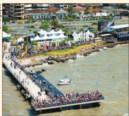
Trapiche Beira-Mar Norte, no Centro de Florianópolis, onde será realizado o Projeto Bem Estar Global, transmitido para todo o Brasil