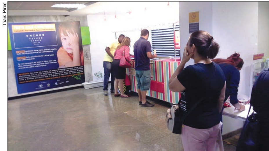
Na estação Siqueira Campos, no Rio de Janeiro, posicionada conforme indicação no piso, usuária segue as instruções para fazer o autoexame, começando por ocluir o olho esquerdo, colocando a mão na frente. Caso encontre dificuldade na leitura, ela é orientada a procurar um médico oftalmologista

Prossegue até o final de janeiro, podendo ser estendida, a Campanha Nacional de Exame Oftalmológico promovida pela Sociedade Brasileira de Oftalmologia com o apoio do Lions Clubs Internacional e o Metrô Rio. Iniciada em novembro em 14 estações da cidade do Rio de Janeiro, a Campanha hoje contempla mais sete cidades: Brasília, Belo Horizonte, Natal, Maceió, João Pessoa, Recife e Porto Alegre. No total, 100 estações de metrô participam da Campanha